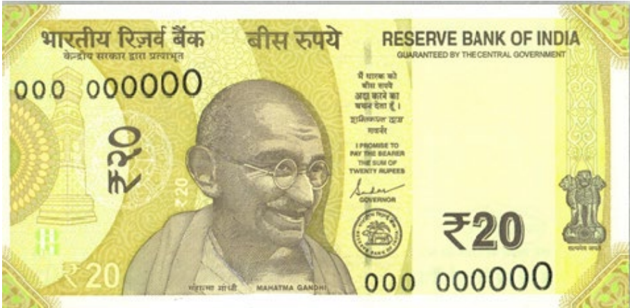
వెనుక వేపు (వెనుకవేపు)